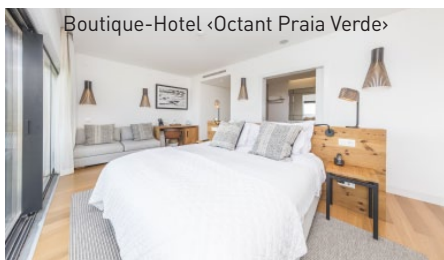
Boutique-Hotel <Octant Praia Verde>